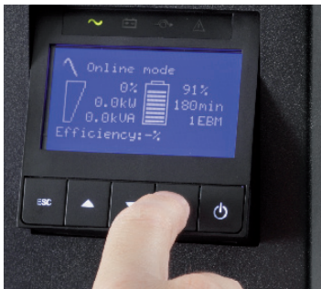
El LCD del 9SX se inclina 45° para facilitar la visualización